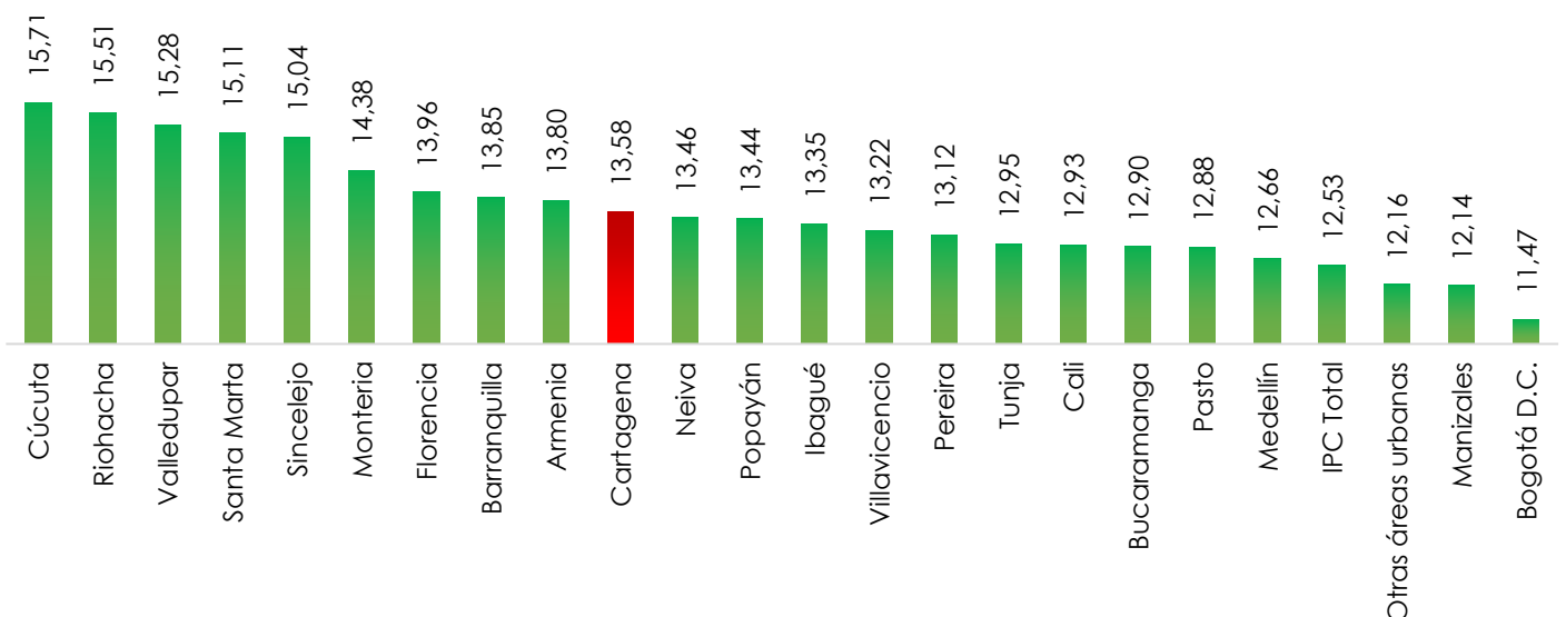
Figura 2. Variación anual del IPC por dominios geográficos, noviembre de 2022

Bogotá, Manizales y otras áreas urbanas tuvieron una variación anual del IPC inferior al promedio nacional (12,53%). Cartagena se ubica como la décima ciudad con mayor inflación anual de las 23 ciudades principales del país, al pasar de una inflación de 4,97% en noviembre de 2021 a 13,58% en noviembre de 2022 .